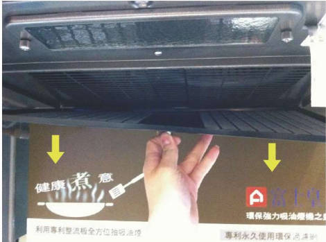
輕按過濾網的旋鈕，將過濾網推前，然後拉下。