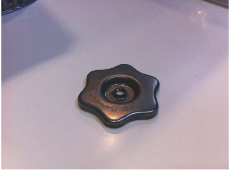
已拆除的六角風扇螺絲