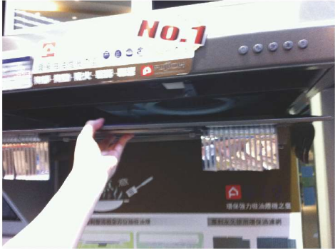
把安全保護網取下時抓牢，以免滑落引起受傷