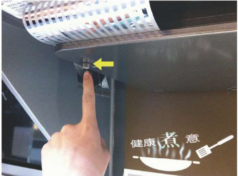
鬆開安裝在整流板上的裝配螺絲，把整流板稍稍向前移動並取下