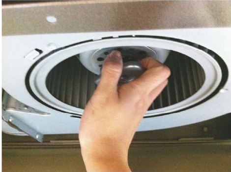
把六角風扇螺絲拆除