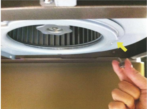
鬆開風扇外環的螺絲