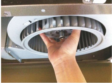
把渦輪式千葉風扇取出